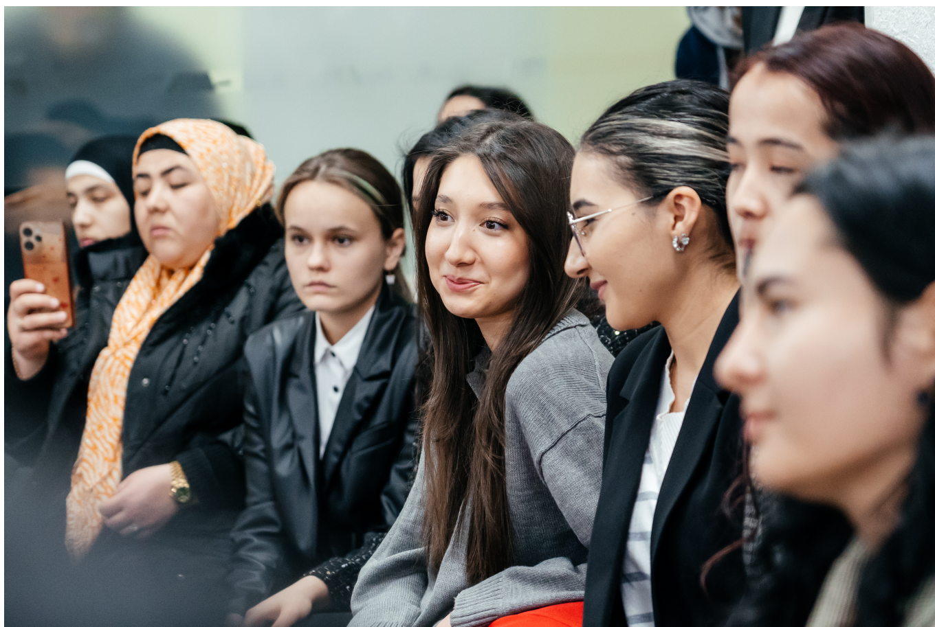
"O'zkimyosanoat" AJ Matbuot xizmati